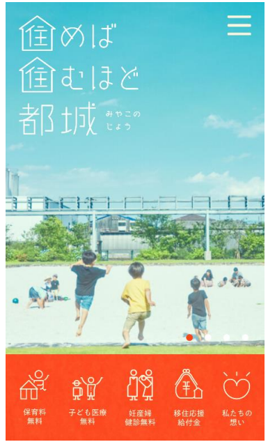
都城市 移住・定住特設サイト