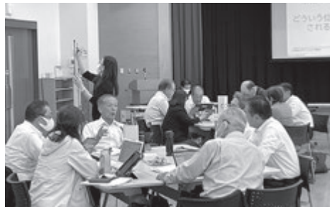
グループごとに活発な議論をしました