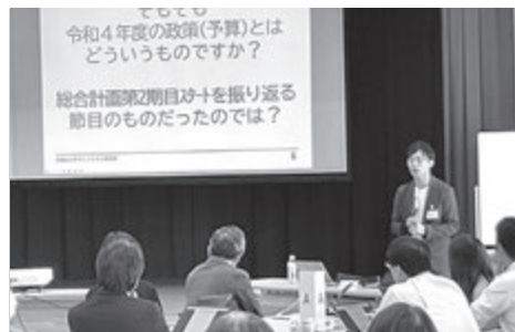
長内アドバイザーによる講話