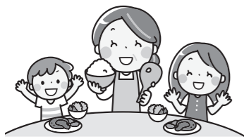
※地域食堂：食を通じた子どもや高齢者の居場所