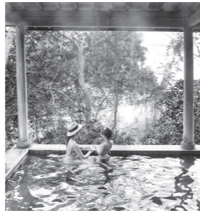
中国の温泉を楽しむ親子