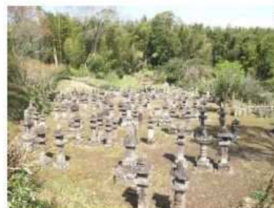
都城島津家墓所(龍峯寺)