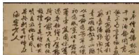
【重文】馮子振墨蹟 与放牛光林語 (ふりしんぼくせき ほうきゅうこうりんにまいたうご) 九州国立博物館所蔵