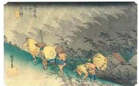
《庄野宿白雨》保永堂版