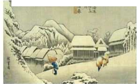
《蒲原宿夜之雪》保永堂版