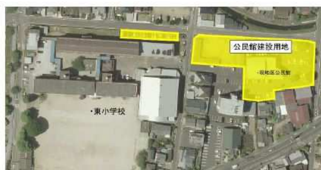
【公民館建設位置図】