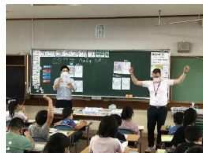
小学校での授業の様子