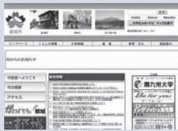
12月リニューアル予定の市ホームページ

各課の事務事業をはじめ、統計などの行政情報や各種申請書様式をホームページ上に掲載し、市民の理解や利便性の向上を促進します