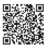
みやざき医療ナビ

※診療機関は変更することがあります。詳しくは、テレホンサービス（医師会 ☎23-5555、歯科医師会 ☎25-4100）で確認してください。