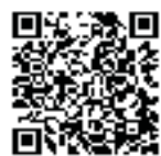
みやざき医療ナビ

※診療機関は変更することがあります。詳しくは、テレホンサービス(医師会 ☎23-5555、歯科医師会 ☎25-4100)で確認してください