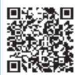
みやざき医療ナビ

※診療機関は変更することがあります。詳しくは、テレホンサービス(医師会 ☎23-5555、歯科医師会 ☎25-4100)で確認してください