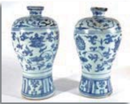
都城歴史資料館企画展「指定文化財で見る都城の歴史」9月9日(金)~11月6日(日)で展示

都城市立図書館 ● 休館日 / 9月19日・20日・22日・26日、10月3日・6日・10日・11日 ● 開館時間 / 9:30 ~ 18:50 ※水曜日は20:00まで開館 高城図書館 ● 休館日 / 9月18日・19日・20日・22日・27日、10月4日・10日・11日 ● 開館時間 / 9:30 ~ 18:00