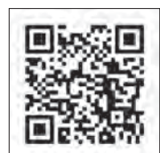
都城市ボランティア・福祉共育おうえんセンター ホームページ

都城圏域のNPO法人や市民公益活動団体の取り組みをホームページ「友・誘・遊」でも紹介しています。ぜひ、閲覧ください。 ※センターでは、冊子も配付しています