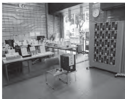
差し押さえたテレビやバッグなどを、平成29年10月に入札方式で公売しました