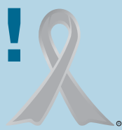
子ども虐待防止 オレンジリボン運動

全国的に児童虐待に関する通報や相談件数は増加傾向にあり、虐待により子どもの命が奪われる事件も後を絶ちません。児童虐待問題は社会全体で解決すべき重要な課題です。