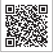
都城市PR連携店 (市ホームページ)

市では、本市と縁のある大都市圏の事業所や店舗をPR連携店として認定しています。PR連携店に「日本一の肉と焼酎、とつておきの自然と伝統」に沿った継続的なPRを行ってもらうことで、本市の魅力大都市圏に浸透させ、認知度の向上や物産の販路拡大などを目指しています。 PR連携店には、事業所や店舗の形態に応じて、のぼりやポップの設置や都城の農畜産物を使ったメニューの提供など本市のPRに協力してもらっています。 出張や旅行の際にはPR連携店を利用してみませんか。