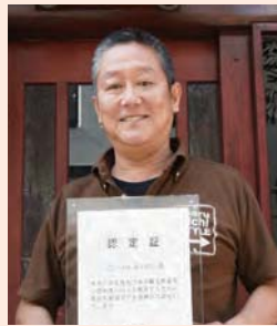
【ごつお屋 まるきち】 福岡市中央区高砂一丁目1-13 ☎092-526-7711