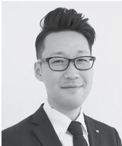
シフトプラス(株)都城営業所