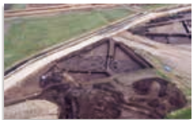
国内最古級の水田跡

この辺りの豊かな湧き水を利用して、都城地方でも米作りが始まっていたものと考えられます。