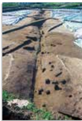
高田遺跡で見つかった溝

これらのことから、高田遺跡は弥生時代の都城盆地での生活の一端を垣間見ることができ、重要な遺跡の一つとして考えられています。