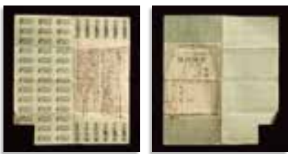
衣料配給切符 (歴史資料館展示中)

その一つが1940年に導入された「配給制」で、砂糖やマッチに始まり、後に米や野菜、果物類、肉・魚介類、薬品、衣類などの生活必需品にまで拡大。特に衣類には、「点数切符制」が導入され、背広50点、袴24点、シャツ12点、ブラウス8点、タオル3点など、種類に合わせて細かく点数が決められていました。