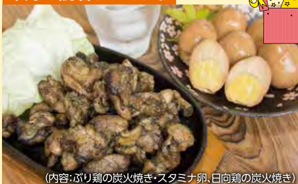
(内容:ぶり鶏の炭火焼き・スタミナ卵、日向鶏の炭火焼き)