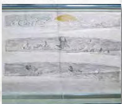
※都城島津邸の特別展で10月13日(土)から11月25日(日)まで展示

薩摩筒の特徴の一つとして、板金の装飾があります。板金とは玉を飛ばす発火装置のからくり部分に当たり、その表面に金銀象眼で見事な装飾が施されています。鹿児島藩では、そうした技術を持った細工師による薩摩筒の独創的なデザインが際立っていました。この絵図には、上から順に、波に月図、川面に鳥図、波間に鶴図の3つが精緻に描かれています。また、都城島津家史料の中に、この見積書も伝来。制作に当たって、デザイン図と見積書を併せて提示していたことが分かります。これまで知られていなかった、鹿児島藩の鉄砲制作の実態をうかがい知ることができる貴重な一枚です。