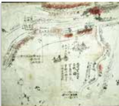
5月20日(日)まで、歴史資料館特別展「戊辰・西南 二つの内戦と都城」で展示

奮戦図は、慶応4年1月4日、5日の鳥羽筋での戦いで負傷・戦死した兵の名前などが書かれている。都城隊が奮戦した具体的な様子を知ることができる貴重な資料です。