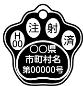
狂犬病予防注射済票