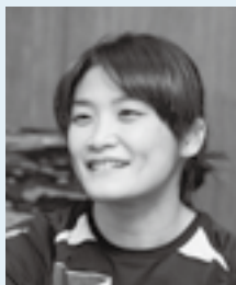
総合警備保障 (ALSOK) 所属 伊調 馨選手

伊調選手は「勝ち負けを意識せず、レスリングがうまくなりたいという気持ちで練習してきた。日々の努力が自信につながる。苦しいことを乗り越えると、人としても成長できる。結果より過程、日ごろの積み重ねを大切にしながら、毎日の練習に取り組んでほしい」と講話。