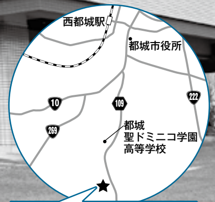
市郡医師会病院跡地 都城リハビリテーション学院