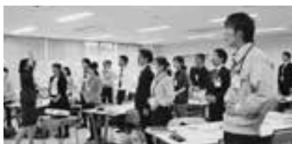
接遇研修の様子(発声練習)

今回のアンケートで指摘のあった内容を踏まえ、さらなる市民サービスの向上のため、今後も接遇研修などを実施し、職員の接遇向上に努めます。