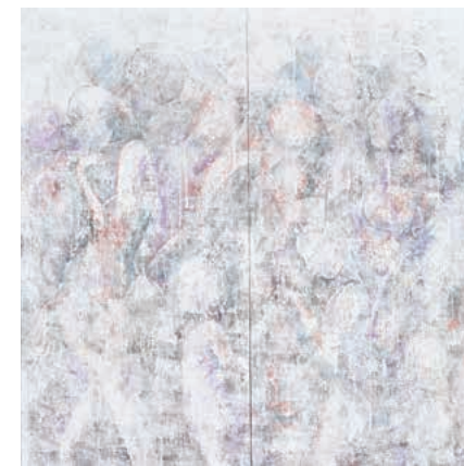
都城市長賞「白夜」 上埜 芳信