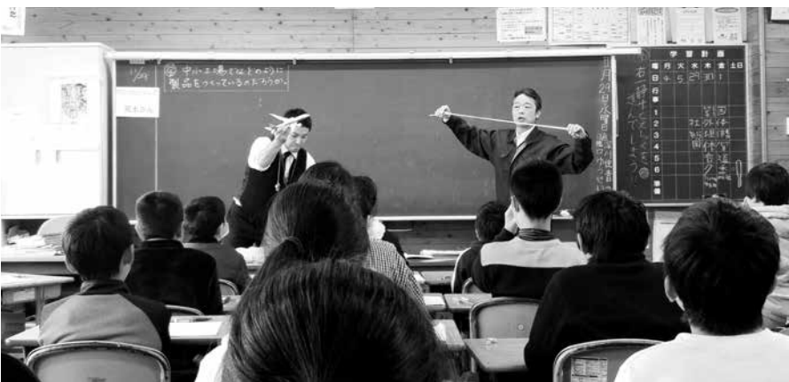
(株)サニー・シーリングによる授業の様子

企業と学校、行政が連携して授業を行うことで、次世代を担う子どもたちの「都城で働く」意識をつくり、将来的な定住化につなげていきます。