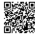
インターンシップ制度

市外に就学または就職している人が利用できるこの制度で、インターンシップに参加してみませんか。制度の詳細い内容や申請方法は、市ホームページで確認ください。