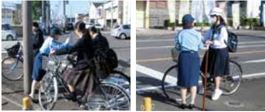
5月に市内の交差点で、自転車マナー向上のキャンペーンを行いました