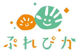
都城市子育て世代活動支援センター