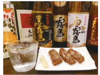
都城の焼酎とつまみの「ゆべし」

「黒霧島」をはじめ、都城のうまい焼酎を取り揃えていて、福岡のお客さんにも大変好評です。そして今、焼酎のつまみとして好評なのが「ゆべし」。ユズとみその風味やピリリと効いた