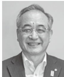
事業担当副市長 岩崎 透 平成26年7月より本市事業担当副市長に就任