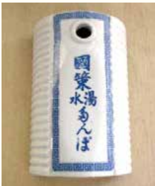
国策湯水ゆたんぽ ※都城歴史資料館で展示中

金属製湯たんぽも供出させられたことから、代用品として陶製の「国策湯水ゆたんぽ」が登場しました。冬は湯たんぽとして、夏は水を入れて陶枕として、また飲料水を貯めるためにも使われました。そのほか、煙草の代わりに松葉や山イチゴの葉などが、ガソリンの代わりに松根油 しょうこんあぶら が代用品として使われました。