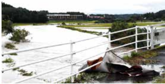
平成28年9月 台風9号の様子