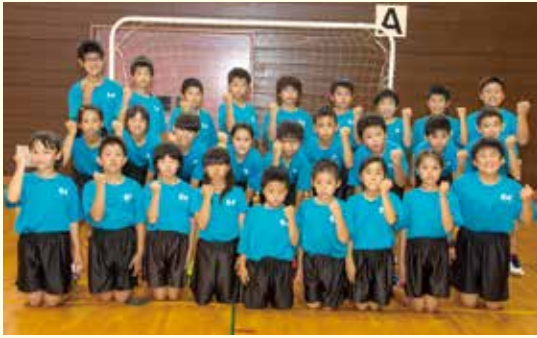
(都城ハンドボールクラブのメンバー)