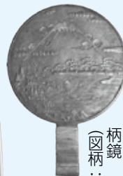
柄鏡 (図柄：富士三保松原)

二字国俊の太刀や、江戸時代の新刀の開拓者と呼ばれる國廣の刀、早水神社に奉納された刀や都城の刀工が制作した刀とともに、円鏡や柄鏡を展示します。