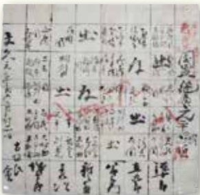
※都城歴史資料館企画展「刀to鏡-inisienobi-」にて3月8日(金)から4月21日(日)まで展示

刀剣類の柄に収まっている持ち手部分は茎と呼ばれ、刀工などの銘が入っています。「入札鑑定」とは、その茎を隠し、形状や刃文、地鉄などからその刀の時代や流派を見極め、作者を導き出すことです。刀剣鑑賞や研究に欠かせない鑑識眼を養う方法として、現在でも全国各地で行われています。