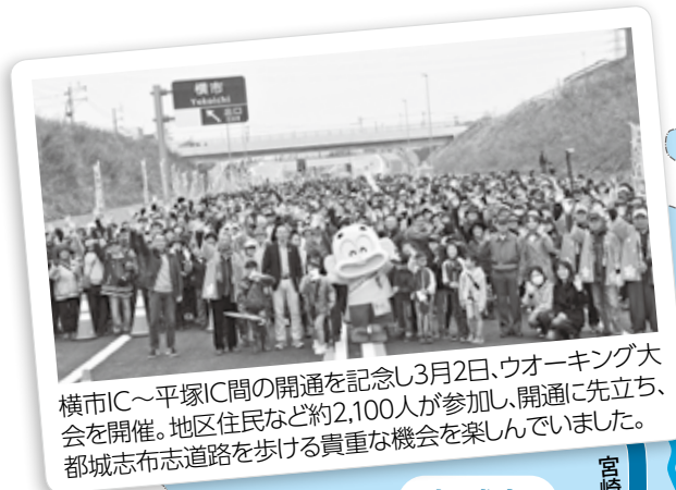
横市IC～平塚IC間の開通を記念し3月2日、ウオーキング大会を開催。地区住民など約2,100人が参加し、開通に先立ち、都城志布志道路を歩ける貴重な機会を楽しんでいました。