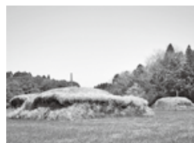
塚原古墳群 (高崎町縄瀬)

しかし、都城にも200以上の古墳があり、100人を超える王族のものともみられる人骨と、副葬品が見つかっています。