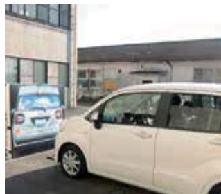
自動ブレーキ体験の様子

高齢者の自動車運転による重大な交通事故が数多く発生していて、その対策が喫緊の課題となっています。そこで4月から、65歳以上の高齢者を対象に、自動車学校での実車訓練や運転シミュレーター訓練、自動ブレーキ機能などを搭載した車「セーフティ・サポートカーS」の体験など、官民連携の高齢者安全運転サポートの取り組みが始まります。自身の運転技術を再確認するためにも、参加してみませんか。申し込みなど詳しくは、総務課まで問い合わせください。