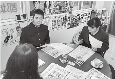
ラジオ番組でもインターハイの情報を発信

県実行委員会都城・北諸支部の推進委員がインターハイの成功に向けて企画・準備・運営に創意工夫をしながら熱心に取り組んでいます。