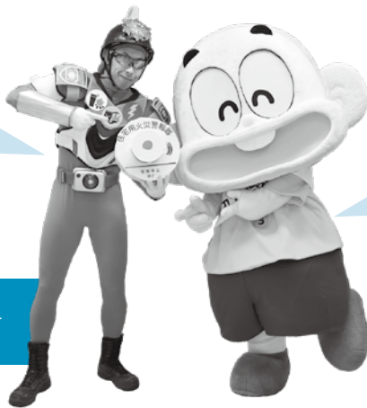
消防局PRキャラクター 消火器マン