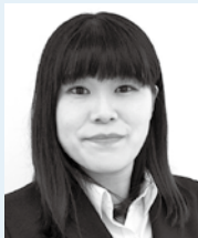
南九州大学 人間発達学部 子ども教育学科 3年