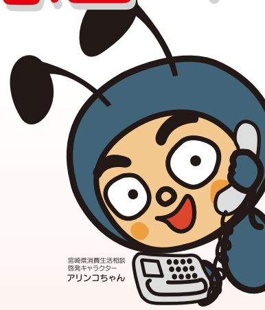
宮崎県消費生活相談 専用キャラクター アリンコちゃん