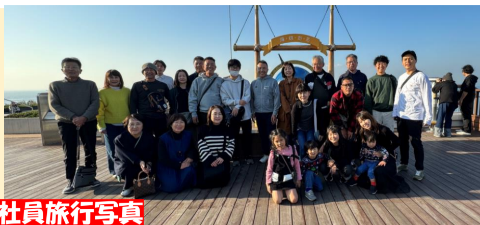
社員旅行写真 (東京～箱根)