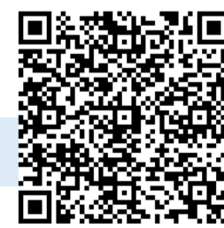
ハローワーク求人

弊社は高所作業や体力を要する仕事で大変な面もありますが、その分福利厚生や給与が高いといった点が特徴です。研修でしっかりと教育していきますので是非興味のある方はご応募ください！