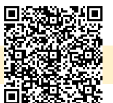
ハローワーク求人

この企業が気になった方は、お近くの紹介担当までお声がけください！ 事業所番号：4504-60039-0