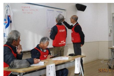
▲無線で各自治公民館から報告を受ける本部の様子▲