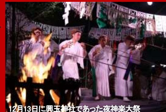
12月13日に興玉神社であった夜神楽大祭

中郷地区公民館だより 令和8年1月発行 発行 中郷地区公民館 TEL39-0713