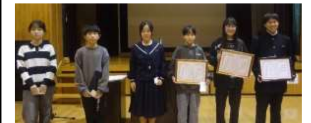
意見発表した皆さん・善行表彰を受けた皆さん