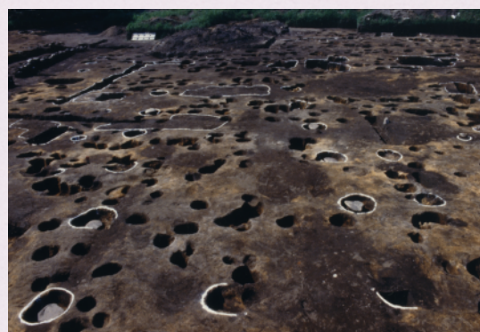
主殿と考えられる建物跡 （資料館が建っている場所）