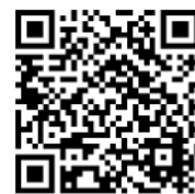
市ホームページ 掲載イメージ （都島の3D）