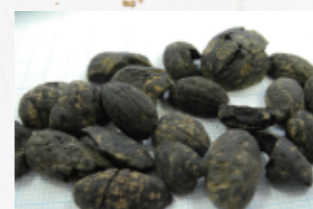
縄文時代 炭化ドングリ(山之口町)