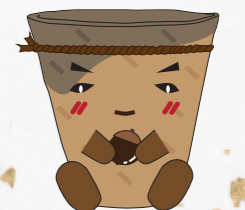
都城市マイブンキャラクター 「いそいちくん」