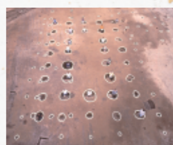
平安時代 大島畠田遺跡(金田町)