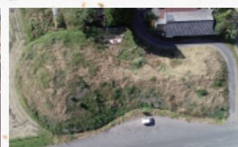
古墳時代 前方後円墳(高崎町)