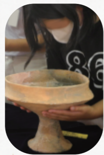
「弥生土器って色々な形があるんだなあ」