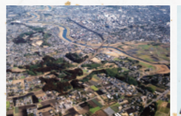
室町時代 都城跡(都島町)