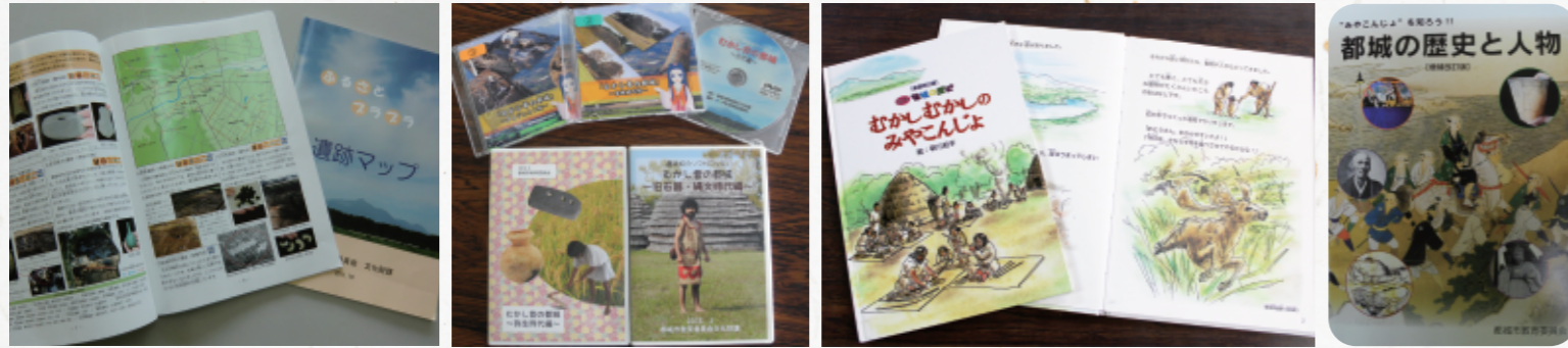
ふるさとプラプラ遺跡マップ