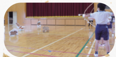
弓矢 イノシシ全部捕まえてやる!!