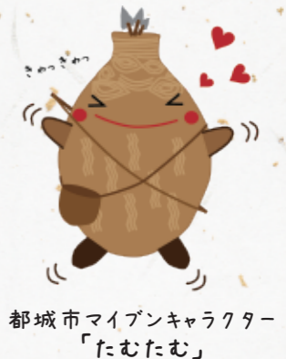
都城市マイブンキャラクター 「たむたむ」

本物の郷土の歴史 に触れてください！！ 子どもたちの歴史への興味 関心度が変わります。