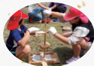
火起こし 2人で力を合わせて頑張りよ!