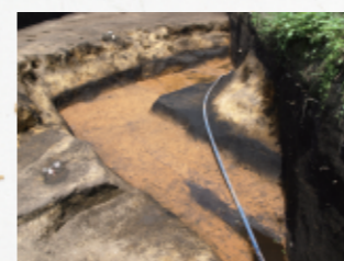
鎌倉時代 郡元西原遺跡(郡元町)