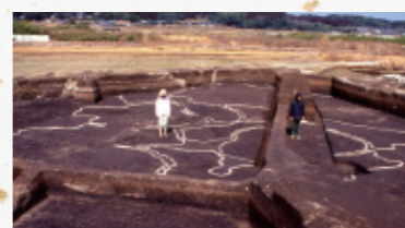
弥生時代 水田跡(南横市町)