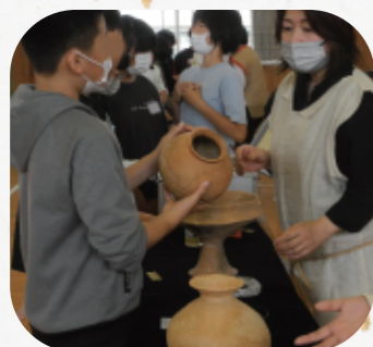
「土器のこの模様は何ですか?」 疑問をその場で質問して解決!