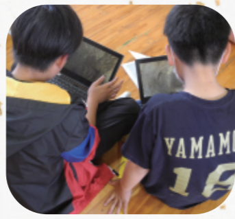
古墳時代のお墓を3D体験☆ 「わあ! 人骨も残っているよ...」