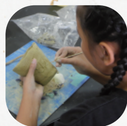
ミニ縄文土器作り 世界に一つだけの縄文土器☆

また、学校内での授業・体験のほか、 校区内の古墳や国指定史跡大島畠田遺跡(金田町) などの現地見学、 都城跡(都島町) での城跡探検なども実施しています。遠足や社会科見学で都城歴史資料館を利用される場合に、併せて体験もできますので御相談ください。