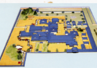
江戸時代 領主館跡(姫城町)