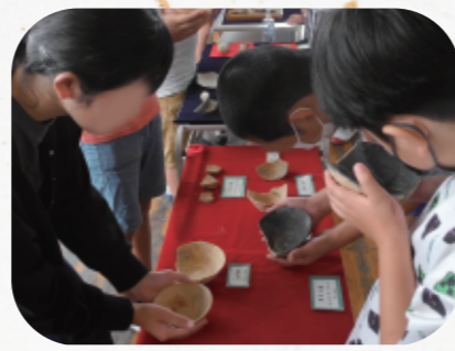
国指定史跡大島畠田遺跡の出土品もさわれるよ! 「1,000年前の器ってとっても軽いね。」