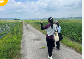
一面に広がる田園風景