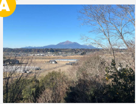
高千穂の峰を望む