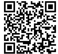
雇用相談登録フォーム