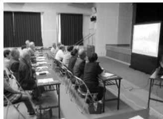
トレーニング講習