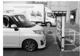
サポカーS乗車体験