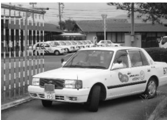
自動車学校での実車訓練