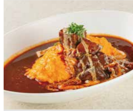
看板メニューのオムビーフシチュー

令和元年のオープン以来、連日満席が続く「福元洋食店」。令和5年には宮崎店も開店しています。3世代がTシャツで気軽に通える「まちの洋食店」である同店は、ケチャップなどのなじみの深い調味料を巧みに使い分け、オムライスにはトロトロ、フライはサクサクと、誰もが親しめる「王道の味」を追求しています。看板メニューは、注文の約4割を占める「オムビーフシチュー」。その味を自宅でも楽しめると評判のレトルト商品「ビーフシチュー」は、年間1万パックを売り上げます。開発