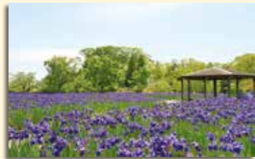
早水公園のアヤメ

先人たちが大切に守り継いできたアヤメは、今では本市の市花となり、毎年早水公園ほか市内各所で多くの人に楽しまれ、愛され続けています。