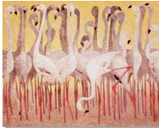
むれ 「群 (フラミンゴ)」 大野 重幸 作 (1966年)