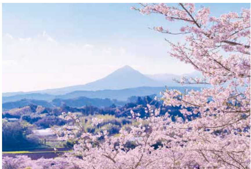
「観音池公園から望む桜と霧島山」(高城町)

【撮影データ】 デジタルカメラ レンズ28~75mm・F2.8、1/250秒 F10 焦点距離75mm ISO80