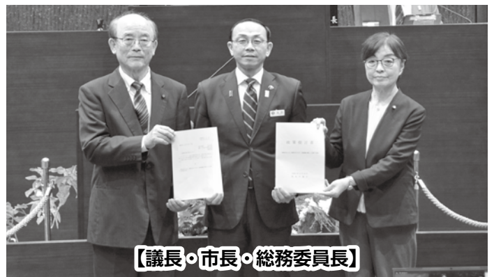
【議長・市長・総務委員長】