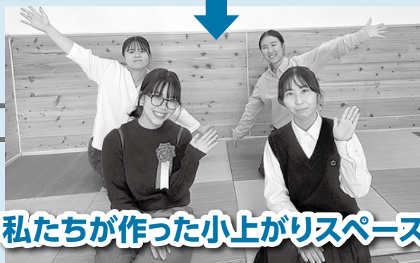
私たちが作った小上がりスペース