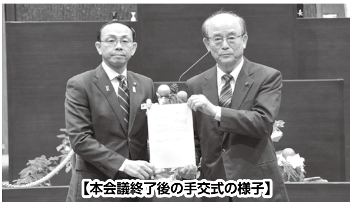
【本会議終了後の手交式の様子】