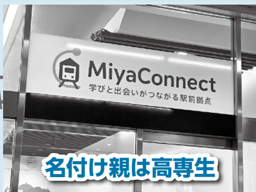
名付け親は高専生