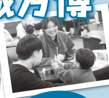
高校生が 企画しました!