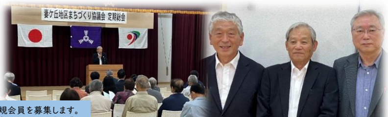
まち協三役の皆様 今年も よろしくお祈りします!