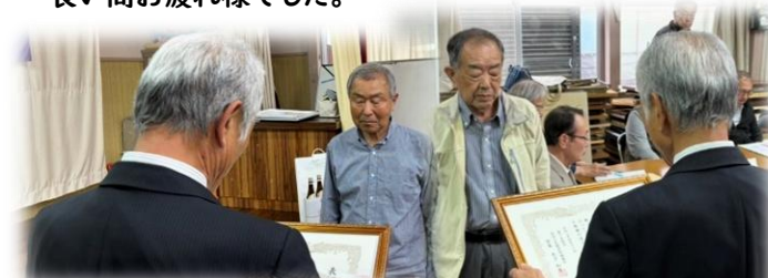
退任された 天神の長友館長と弁済使の猪ヶ倉館長

総会では、令和8年度の事業計画等について承認されました。また、昨年休止していた一万城南部自治公民館が復活し、本年度から16の自治公民館で活動します。また、2つの公民館長が、変わられましたので感謝状を授与しました。 長い間お疲れ様でした。