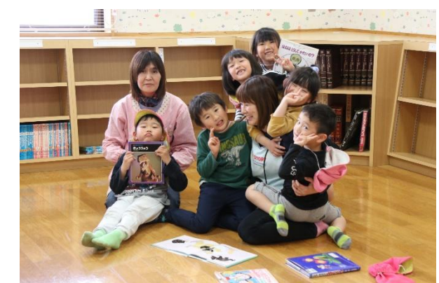
▲好きな絵本を手取る児童

絵本や図鑑を手に取り、黙読したり先生に読んでとお願いしたりして、ひとときを過ごしました。