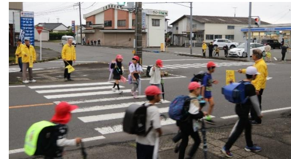
▲黄色いスタッフジャンパーを着て誘導する館長ら

小学校の入学式の翌日、4月14日(火)の午前7時から行われ、協会の会員や自治公民館長らが、梅北と安久に別れ、主要交差点の横断歩道で黄色の小旗を持ち小学生の横断を誘導したり、ドライバーへ安全運転と飲酒運転撲滅の啓発ちらしを配布したりしました。