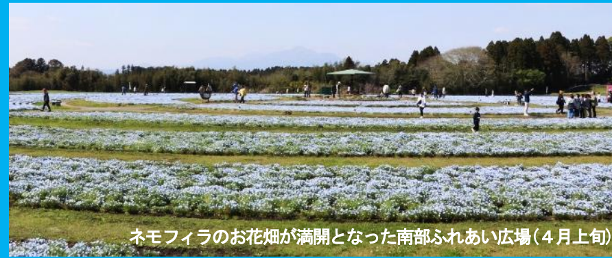
ネモフィラのお花畑が満開となった南部ふれあい広場(4月上旬)

中郷地区公民館だより 令和8年5月発行 発行 中郷地区公民館 TEL39-0713