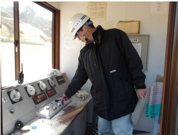
運転室機械作用確認