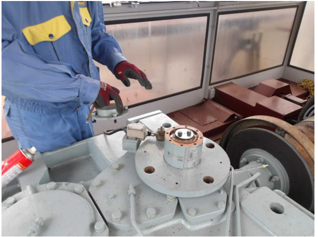
減速機グリス状態確認