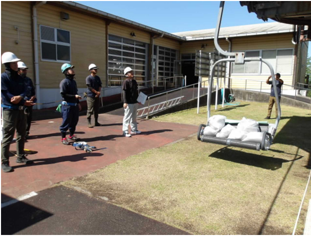
荷重制動試験（上がり最大負荷）