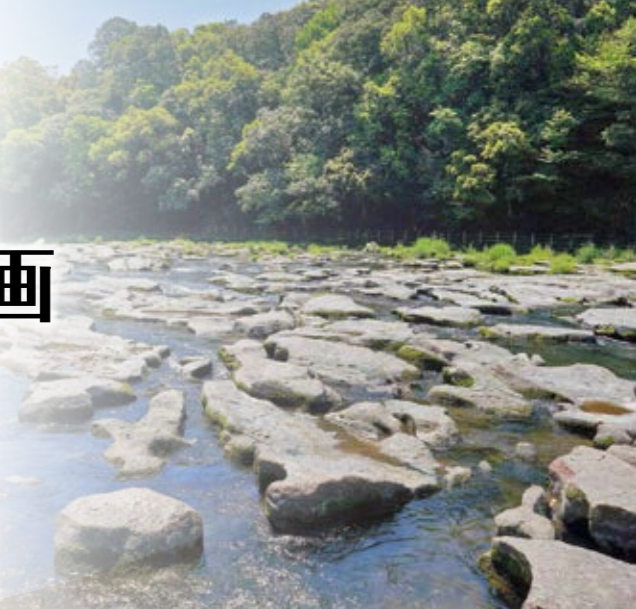
関の尾の窟穴(国指定天然記念物)