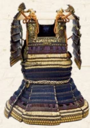
紺糸威紫白肩裾胴丸(重要文化財)