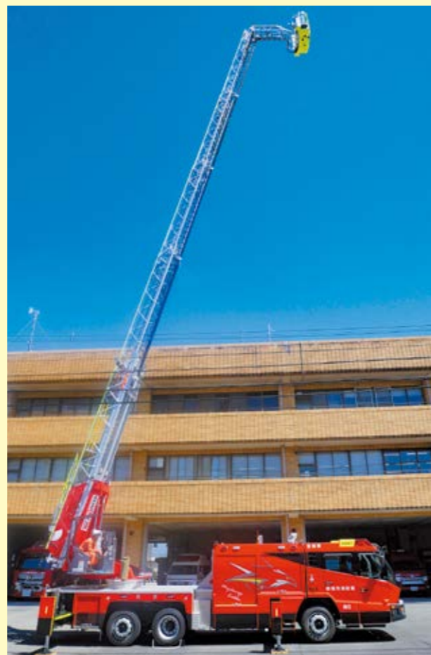
南消防署に配備した30m級先端屈折式はしご車