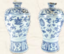
青花磁器瓶一对(市指定有形文化財)