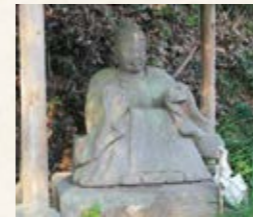
【谷川】田の神(市指定有形文化財)