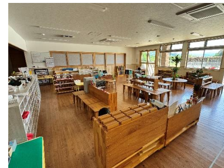
【施設整備費補助金で整備した施設（石山保育園）】