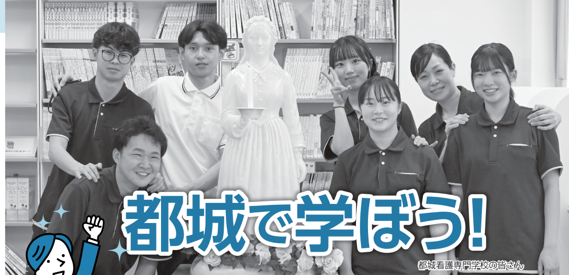
都城看護専門学校の皆さん

☆ 都城には、就職に必要な知識や技術を学べる学校が数多くあります。自宅から負担が少なく通える学校を進学先を選んでみませんか。 令和9年度の市内・三股町内の大学や高専、専門、専修学校の学生募集状況をお知らせします。出願期間は、複数回設定している学校があります。詳しくは、各学校にお問い合わせください。 また、市ホームページでは各学校の紹介動画を掲載しています。自宅で気軽に視聴できますので、ぜひご覧ください。 ◎問い合わせ 総合政策課 ☎23-7161