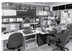
高機能消防指令センター更新 12億560万円