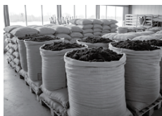
農業資材等価格高騰緊急支援事業 2億398万円