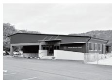
就学前教育・保育施設整備費補助金 5億8,716万円