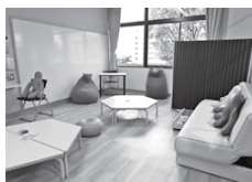
学びの多様化学校設置事業 1億3,555万円